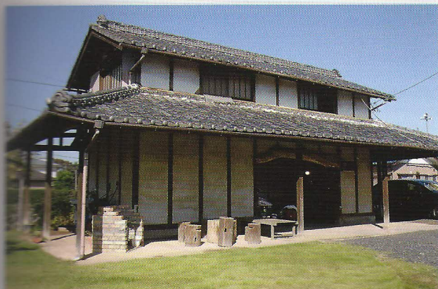
外観は、ほぼ元々の納屋の状態のままですが、不便な部分にはできるだけ目立たないように補修とリペアが施されている

text : TANSHACLUB