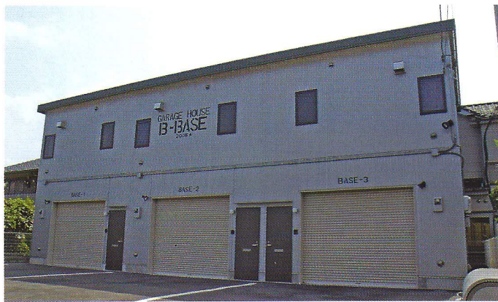
◀ 高塚オーナーの物件は米車の格納庫の雰囲気が

車やバイクを趣味とする人たちから注目を集めているガレージハウス。安全に保管できる上に、“いじる”ことができる作業スペースが魅力だという。